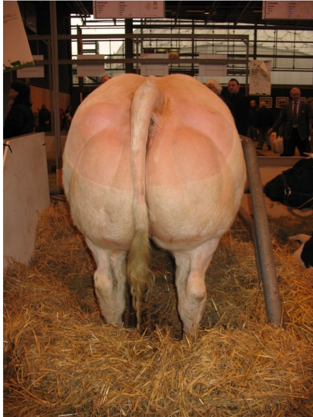
Rysunek 8.6. Wystrzyżenie dla pokazania umięśnienia