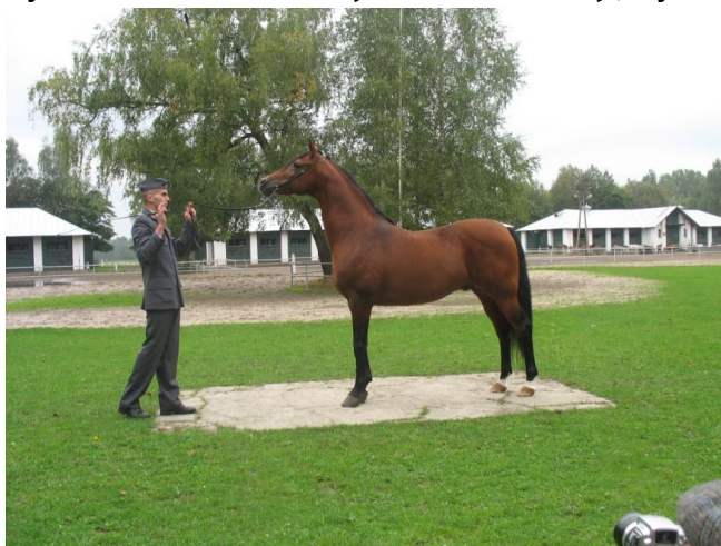
Rysunek 8.4. Prezentacja konia na aukcji, wystawie