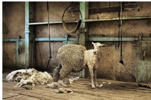
Rysunek 6.15. Strzyżenie owiec