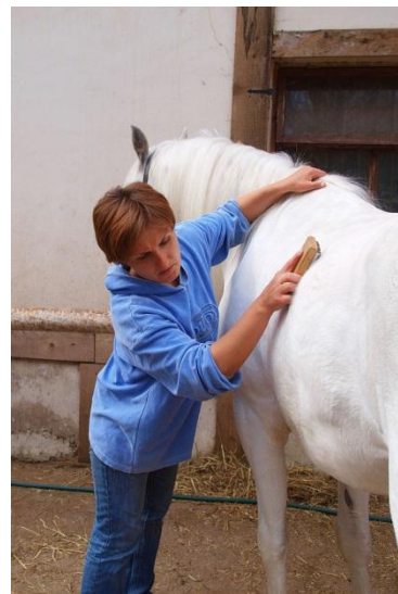
Rysunek 6.14. Czyszczenie sierści