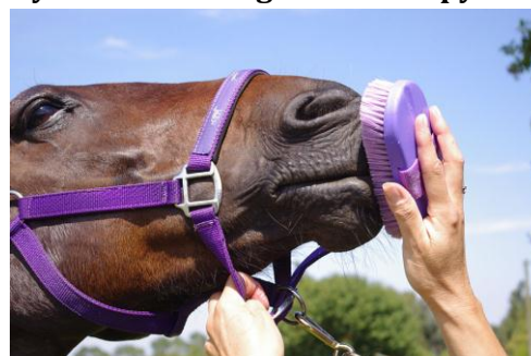
Rysunek 6.11. Higiena okolic pyska