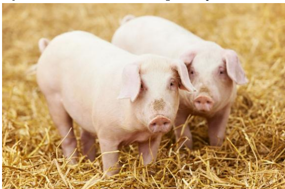
Rysunek 6.10. Zadbane prosięta