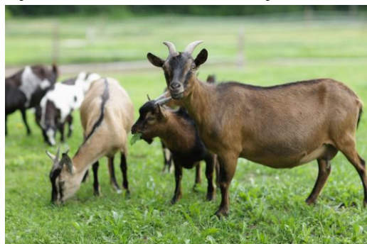
Rysunek 6.16. Zadbane kozy