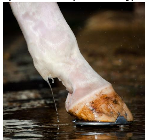
Rysunek 6.12. Czyszczenie kopyt