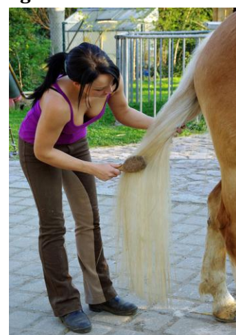
Rysunek 6.13. Czesanie ogona