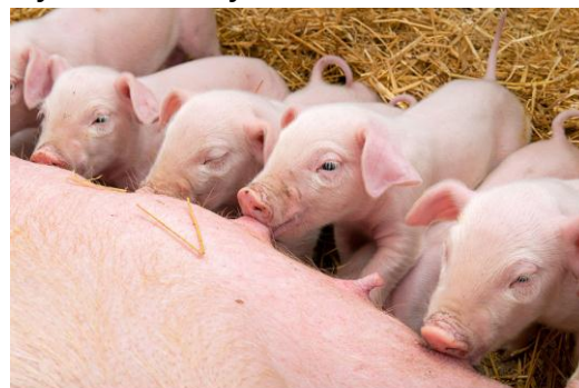
Rysunek. 6.9. Prosięta podstawione do wymienia lochy