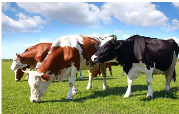
Rysunek 6.1. Zadbane bydło